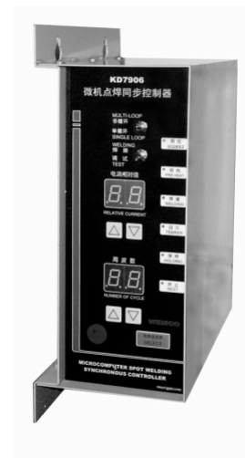
图一、控制器外形图

由于采用了低功耗的单片机芯片 WE7988,使得本控制器整机功耗只有 15W。实属节能产品。本控制器的高度集成化,尤其是 I 2 C 总线和数字显示技术的应用,使得电路十分简洁。这不仅便于产品的调整、维护和保养。